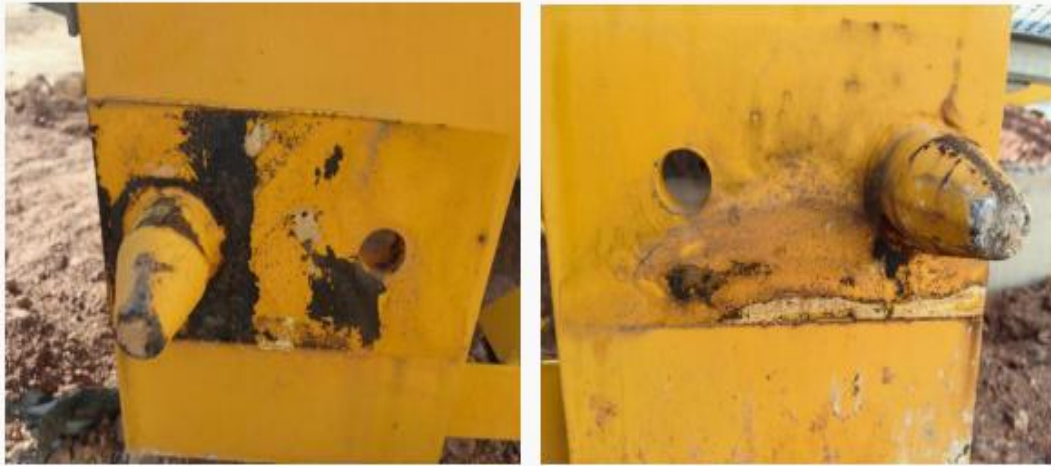
图 3-16 事发后平衡臂后臂节下弦杆接头处定位销轴上表面存在刮擦痕迹