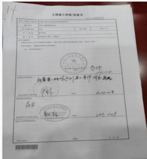
图 3-36 《工程复工申请/批复书》尚未经工程项目监督机构受理签发