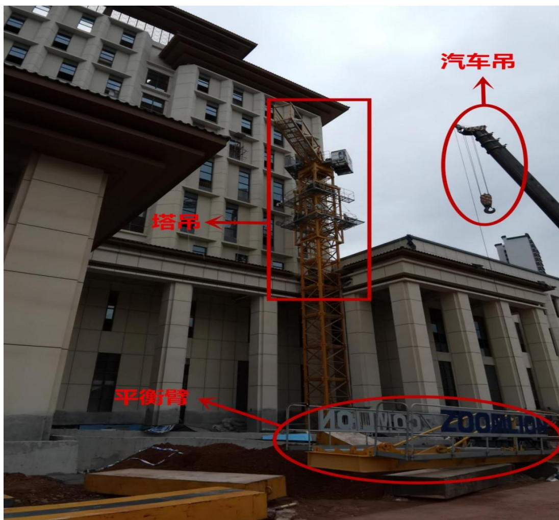
（图2：调查组进场时的现场状况）