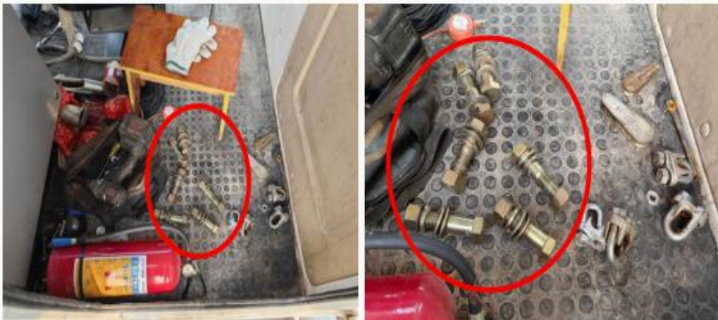
图 3-18 放置在司机室的接头处连接螺栓(6套)