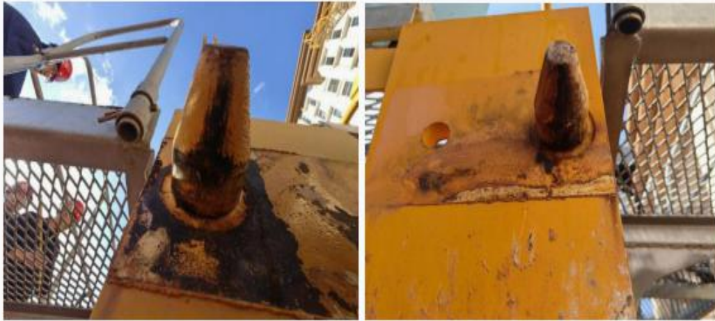
图 3-17 事发后平衡臂后臂节下弦杆接头处定位销轴下表面存在刮擦痕迹