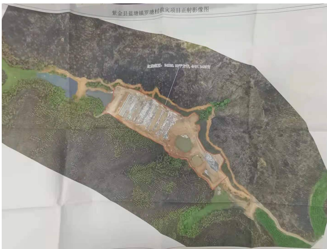
图 1: 红线图。红线占地面积为共 24828 平方米 (37.24 亩)

养猪场猪舍建设按照《建筑法》和住建部门职能,不纳入工程建设监管范畴。其建设行为由属地镇政府负责日常监管。事故发生时,尚未进行畜禽养殖。